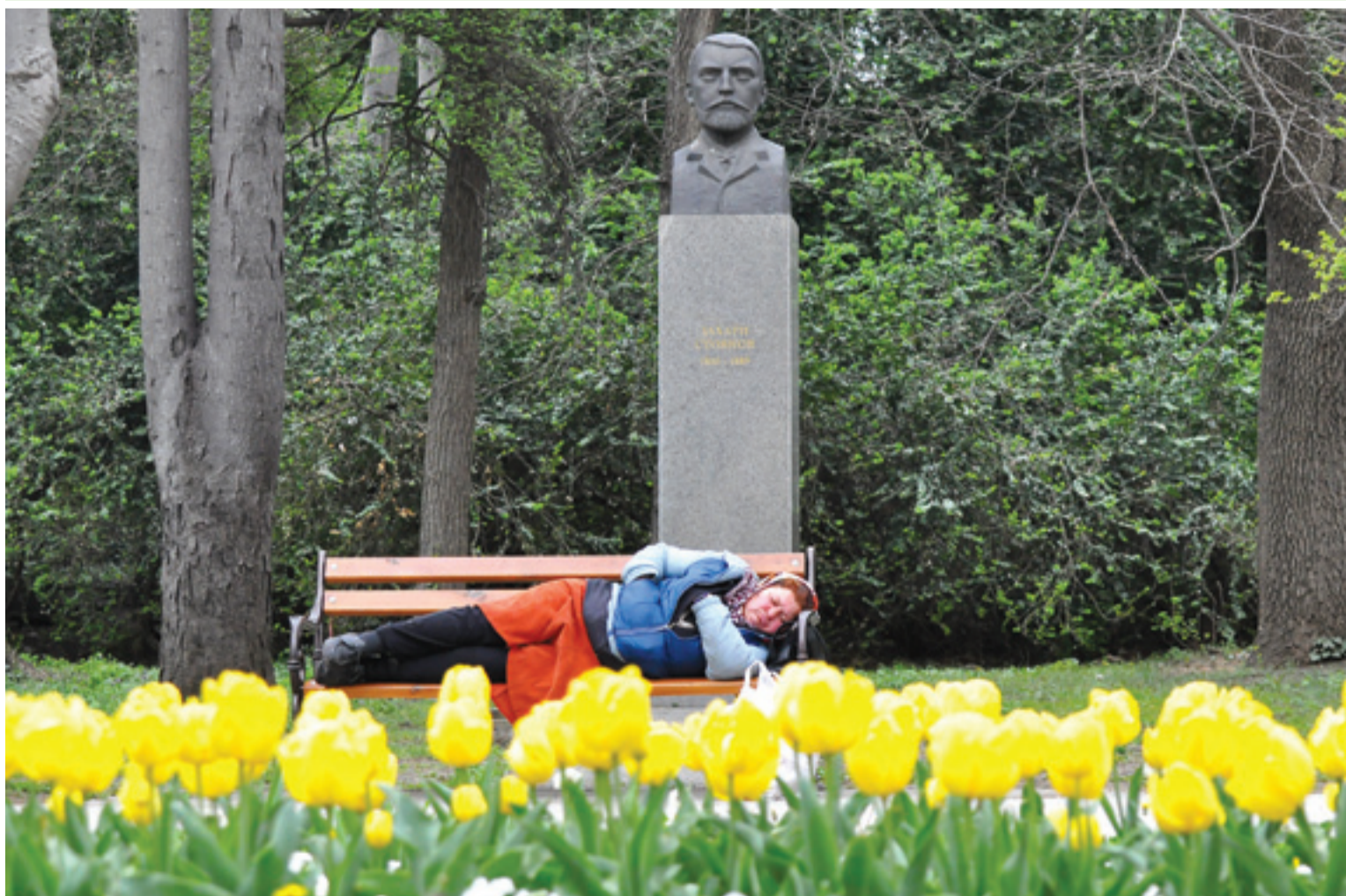
ВРЕМЕТО СЕ ЗАТОПЛИ и стана подходящо за разходки. А защо не и за дрямка на чист въздух на пейките в Морската градина?

Строежът на Интермодален терминал - Варна, е сред най-значимите проекти