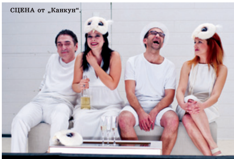
СЦЕНА от „Канкун“.

„Канкун“ е като игралните машини – пленява те, прелъстява те, държи се почти любовно, разфокусира ума, отваря фантазията, действа почти прищивно. Канкун – като някакво облизващо се хищно животно – седи насреща ти и те пита къде си, в коя биография, в началото или в края на коя любов, в кое свидетелство за нещо преживяно, в кое опре-