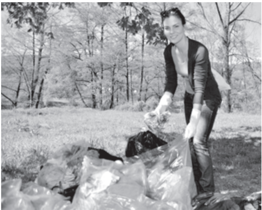
СТАРИ ТЕЛЕВИЗОРИ, АВТОМОБИЛНИ ГУМИ И КУПИЩА ДРУГИ БОКЛУЦИ почистиха доброволци от езерото Панчарево.

Въпреки голямото количество пълни чували с отпадъци – около 60, участниците в акцията твърдят, че с всяка година този район става все по-чист и количеството изхвърлени отпадъци са далеч по-малко отпреди пет години. ЧМ