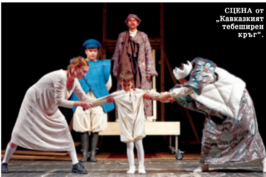
СЦЕНА от „Кавказкият тебеширен кръг“.

„Едноокият цар“ на сцена „Филиал“ от 19 часа. Творбата е на Марк Креует, превод Нева Мичева. Режисьор