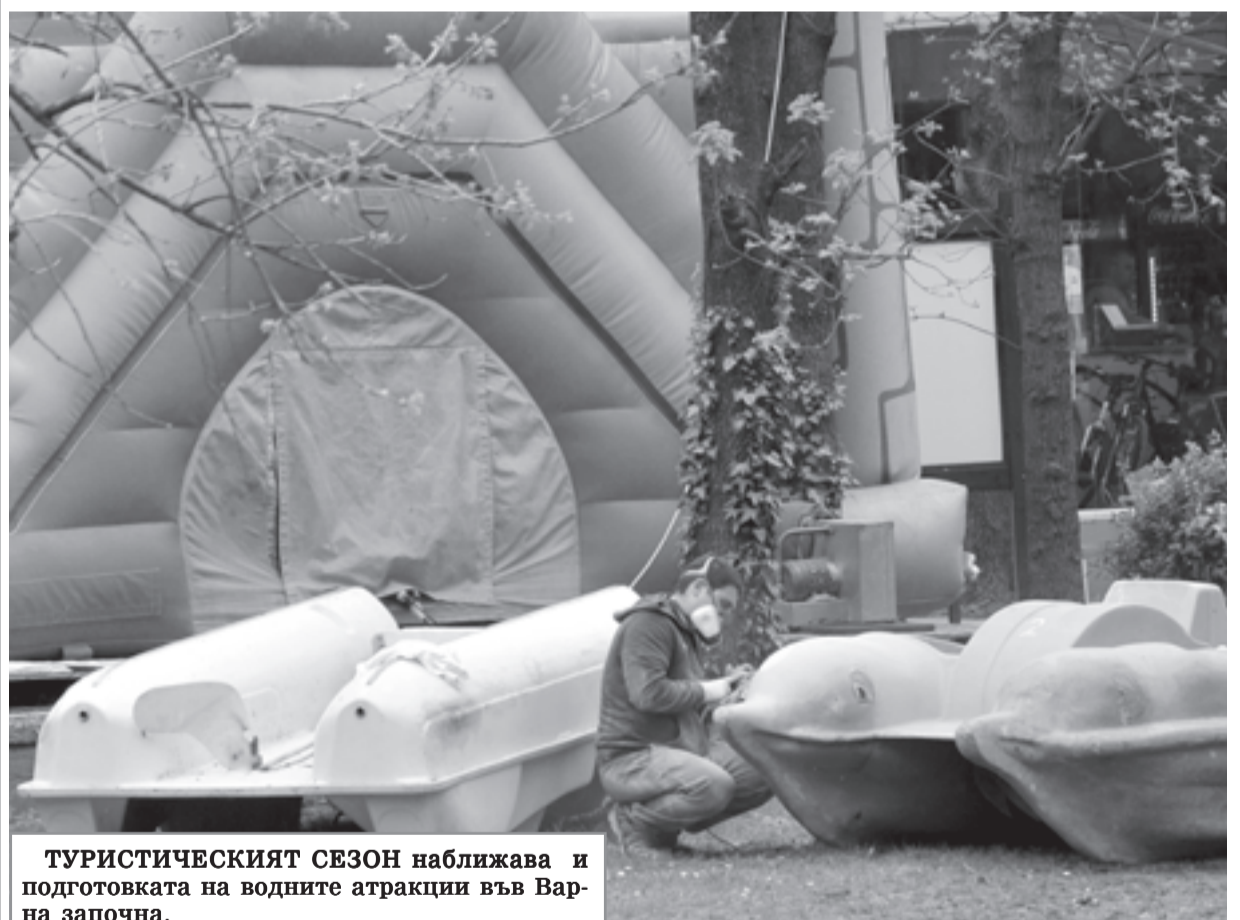
ТУРИСТИЧЕСКИЯТ СЕЗОН приближава и подготовката на водните атракции във Варна започна.