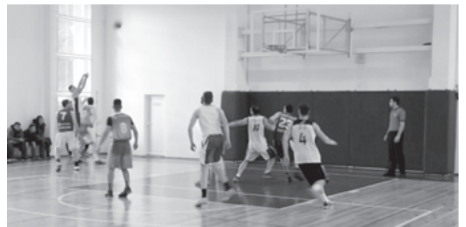
ПРОГРАМАТА ПРОДЪЛЖАВА ДНЕС с футбол и волейбол.

Също днес на терена на Техническия университет започва турнирът по мини-футбол от 16 часа със срещите между новия университет ВУМ срещу МУ и вторите отбори на ВВМУ2 - ИУ2. Финалът на футболния турнир е насрочен за 22 април от 15 часа на ОСК „Морска градина“.