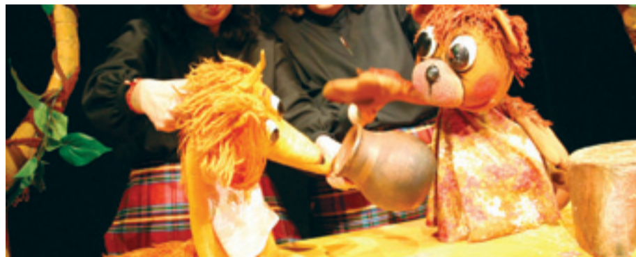
СЦЕНА от „Лакома мецана“.