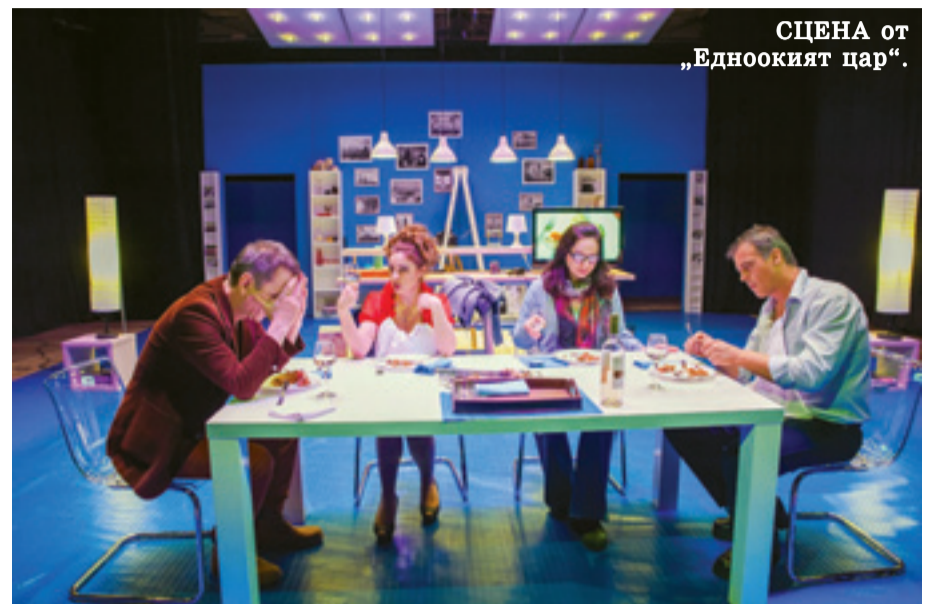
СЦЕНА от „Едноокият цар“.