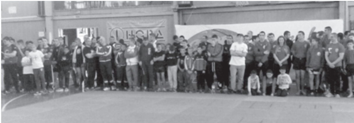
В СЪСТЕЗАНИЕТО се включиха бойци от 19 клуба в страната.

В „Купа Варна“ се включиха над 140 бойци от 19 клуба в страната, които премериха сили в различните стилове на ринга и татамито.