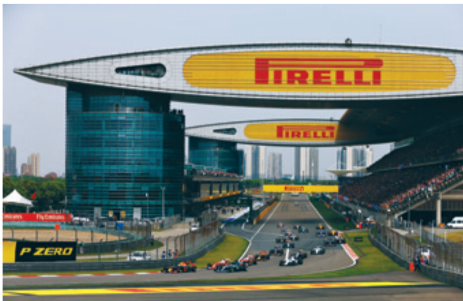
ЗА ВТОРОТО МЯСТО се пребори пилотът на „Ферари“ Себастиан Фетел, а Даниил Квят си спечели мястото на подиума.

До финала нямаше време за изненади и тримата лидери запазиха позициите си. С третата победа от началото на сезона Нико Розберг увеличи преднината в класирането пред съотборника си Люис Хамилтън на 36 точки. След отпадането си в миналия кръг в Бахрейн Себастиан Фетел се върна в битката в челото със спечеленото второ място вчера.