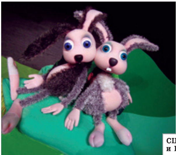
СЦЕНА от „Сиводрешко и Бързобежко“.

ла Лисицата и знае ли всичко любопитната Сврака. Музиката към постановката е на Иван Кръстев, а сценографията на Адриана Добрева.