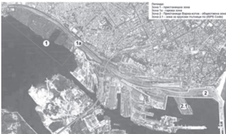
ОБЩ ВИД НА РАЙОНА ЗА ИЗГРАЖДАНЕ НА ИНТЕРМОДАЛЕН ТЕРМИНАЛ "ВАРНА"

ИМА ПОНЕ ТРИ НАЧИНА ЗА ИНВЕСТИРАНЕ в новия Интермодален терминал - Варна, чийто проект ще бъде окончателно завършен до края на годината.