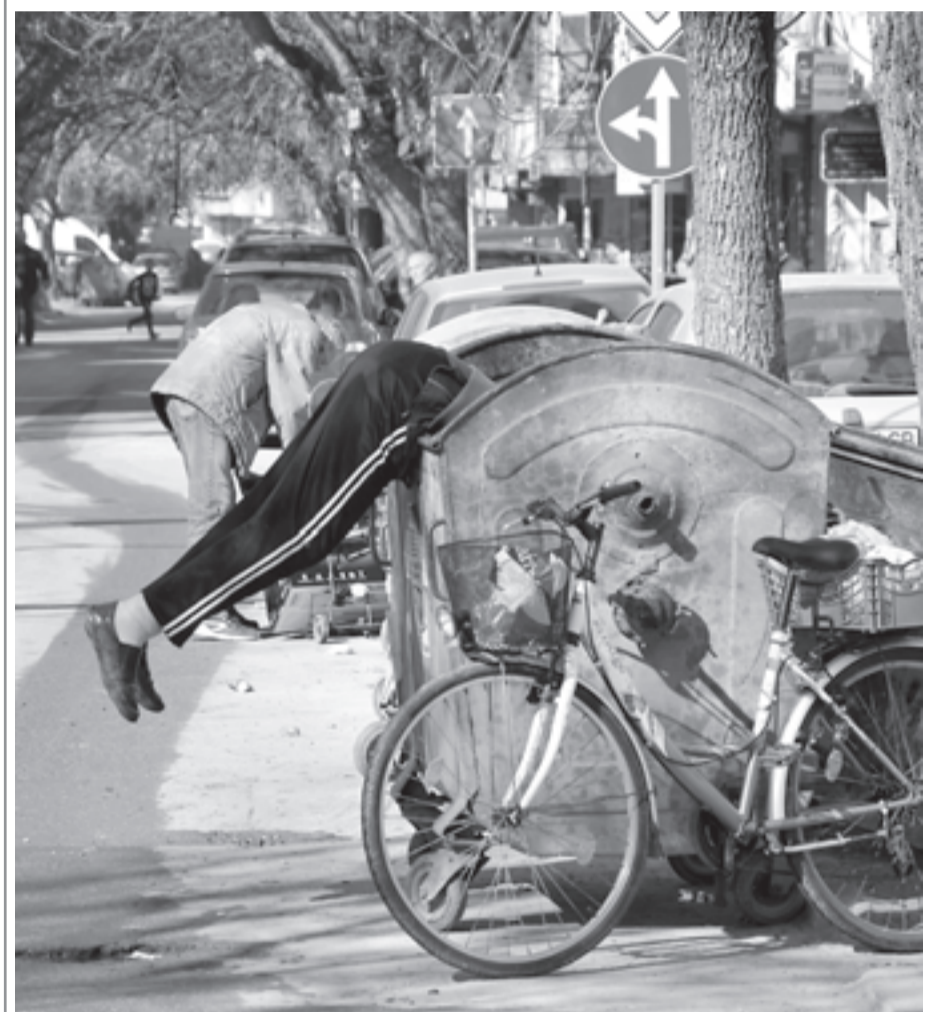
ЗА НЯКОИ ТОВА Е НАЧИН ЗА ПРЕПИТАНИЕ. Този мъж е влязъл до кръста в контейнер за смет, търсейки нещо, което може да продаде на вторични суровини, или пък да намери някоя и друга „ценност”.