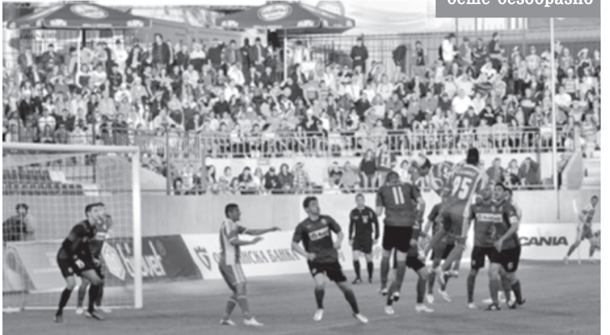
ДОБРАТА ИГРА на варненци не се увенча с успех.