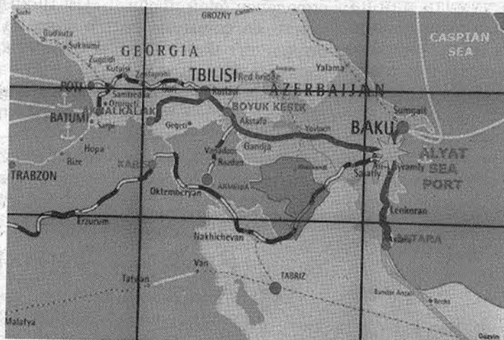
ЖЕЛЕЗОПЪТНА И ШОСЕЙНА ЛИНИЯ ЩЕ СВЪРЗВА мултимодалния център в Баку с черноморските пристанища Потти и Батуми, а от там по море - до Варна.

Баку е известен като пристанищен град от векове. Той