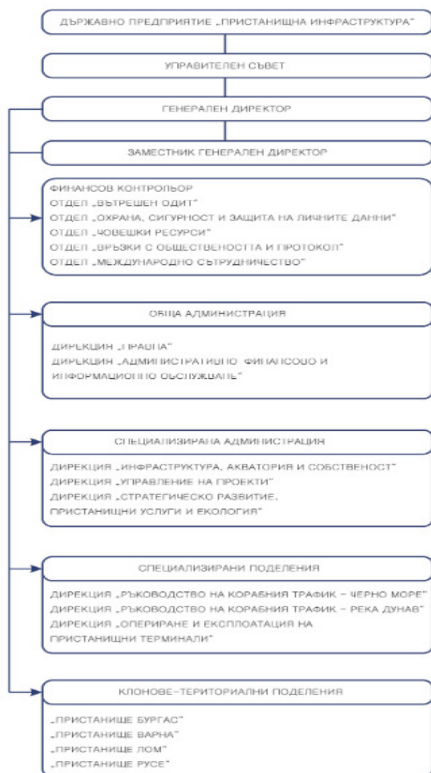
Фигура 1. Структура на ДППИ

Структурата на ДППИ е представена във Фигура 1: